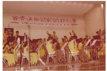
慶祝教師節國樂演奏會，由省立臺中圖書館中興國樂團傾力演出。