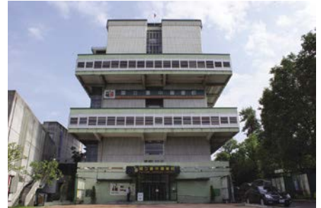
從臺灣省立臺中圖書館升格為國立臺 中圖書館外觀，以及館員合影。