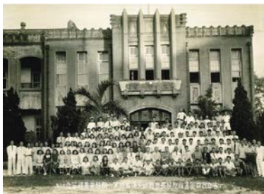
省立臺中圖書館附設民眾國語文補習班第一期結業典禮留念。