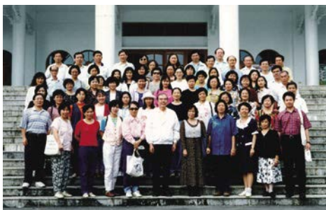
臺灣省立臺中圖書館員工消費合作社合作 教育觀摩活動。