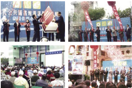
金點子計畫點燃推動臺灣公共圖書館升級再造的風潮。