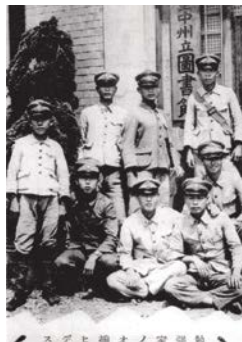
一群學生攝於臺中州立圖書館門口。