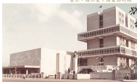
省立・國立臺中圖書館時期

遷移至臺中公園（現今精武分館），所屬的中興堂啟用，並擴大編制，增設藝術教育中心及科學教育中心。