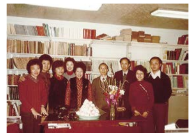
採編館員於1984年合影。採編館員是圖書館負責選書採購及編目工作職務的館員。

接受教育廳委託辦理「全省優良圖書及兒童讀物巡迴展」，同年接受教育廳委託代辦選購圖書贈各鄉鎮圖書館。