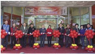
中興分館全新開館典禮照片。