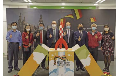
比利時資料中心開幕。