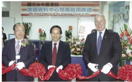
美國資料中心於國立臺中圖書館成立。