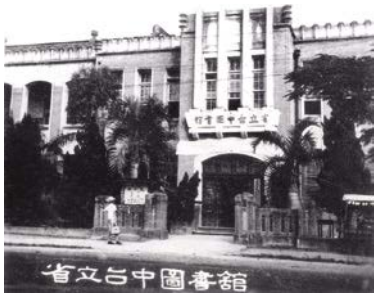
臺灣省立臺中圖書館。