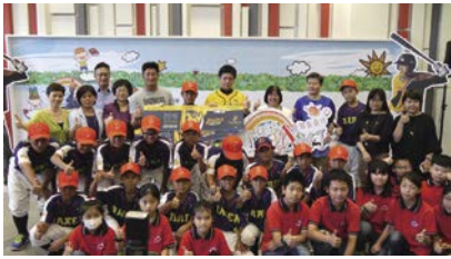
2016年「閱讀全壘打·夢想象前行」系列活動擴大推廣觸角，為臺灣揭開「棒球×閱讀」的家庭文化運動。