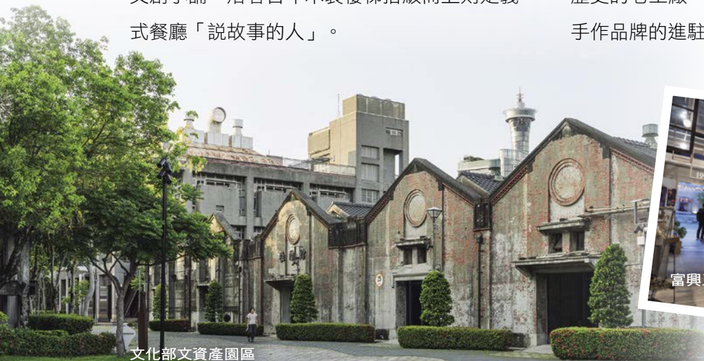
文化部文化資產園區

臺中老城區有意思的歷史建築不僅於此，曾是全臺最大釀酒廠的「大正製酒株式會社」，是日治時期建築，如今成為文化部文化資產園區，非常適合拍照，不僅有古色古香的日式傳統建築、吸睛的彩繪大酒桶，也不定期舉辦展覽或文創市集。另一個有趣的老工廠再生轉型則是「富興工廠 1962」，這是臺灣第一家化妝品製造廠「盛香堂工廠」旗下60年歷史的老工廠，如今成為甜點、咖啡、服飾與手工作品的進駐地。