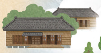
台中刑務所官舍群