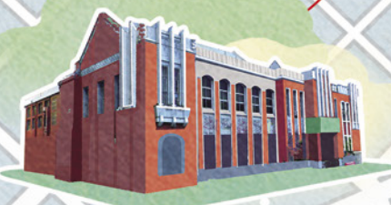
合作金庫銀行 台中分行