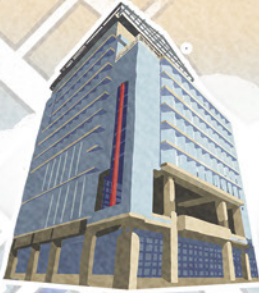
台中市第四信用合作社