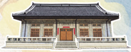
臺中刑務所演武場