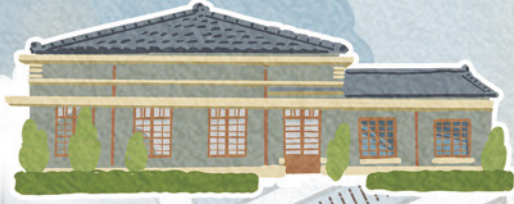
帝國製糖廠臺中營業所