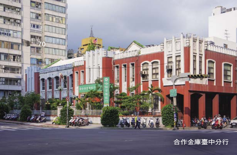
合作金庫臺中分行