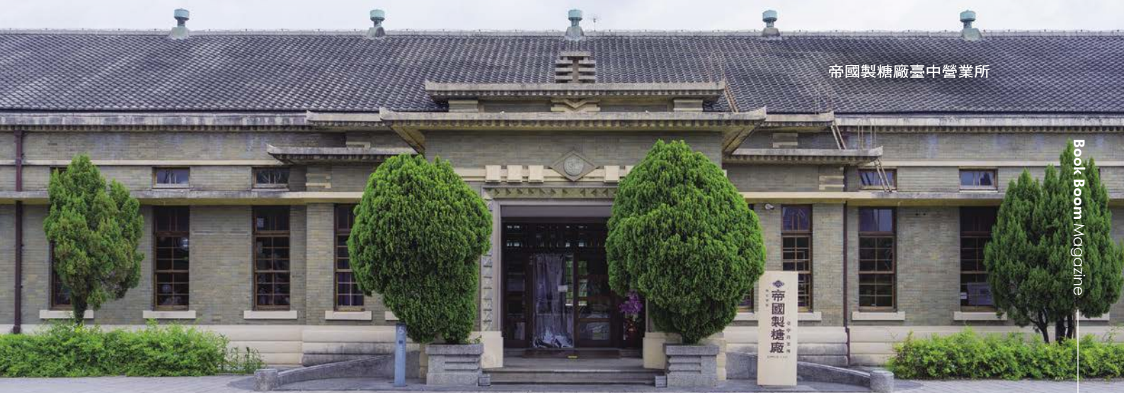
帝國製糖廠臺中營業所

目前建築內有「冶糖」與「1935 Cafe & Bar」兩間餐飲業者進駐，亦定期更換展覽主題可免費參觀，即便不用餐也可在日頭西下時沿著周邊環湖步道徐徐行走。偶有飛鳥掠過空中，讓人驚喜於熙攘城市中心也有如此景致，臺中的舊城散策，便是如此恰恰巧地自然融入於我們的日常生活之中。✦