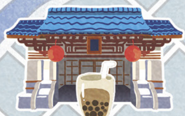
春水堂 四維創始店