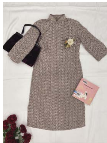
1 2 3 4