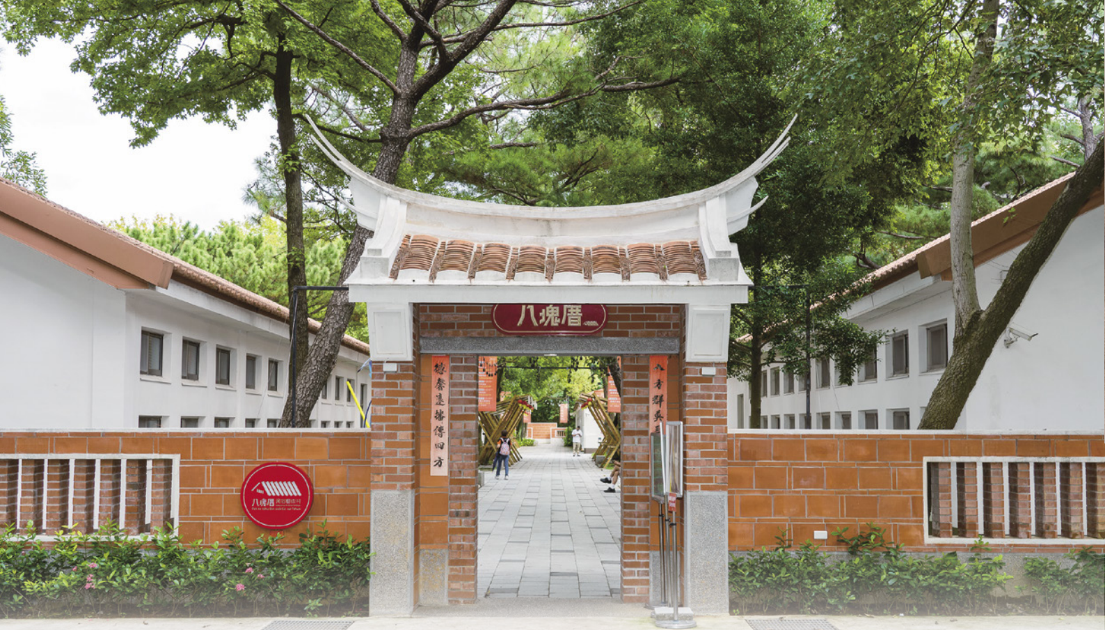
八塊厝民俗藝術村