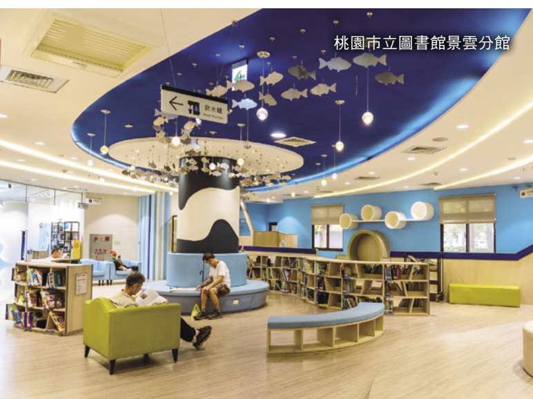
桃園市立圖書館景雲分館

週末假日，父母想帶小孩外出放電，不妨來趟桃園八德的兒童玩具圖書館，滿足小朋友當「玩具富翁」的心願，善用豐富多元的公共資源，享受育兒友善的美好空間。✚