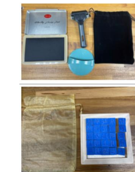
圖 10 印刷演進教具箱教具內容

另外國資圖也與財政部印刷廠臺灣印刷探索館合作開發《呃搞印刷》桌遊，共含 64 種印刷元素卡牌，讓玩家在遊戲之餘能更加認