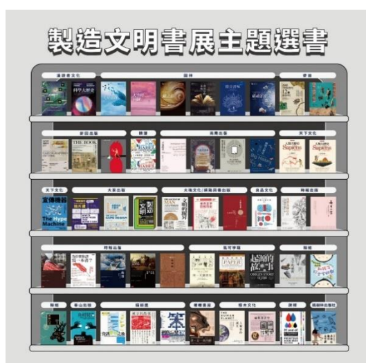
圖 6 製造文明書展成人選書