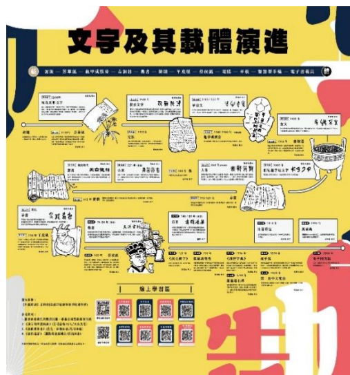
圖 4 文字及其載體演進展架