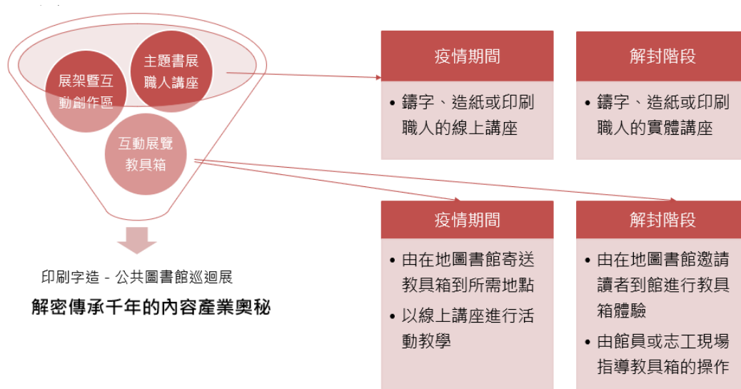
圖 11 印刷字造巡迴展展示規劃架構