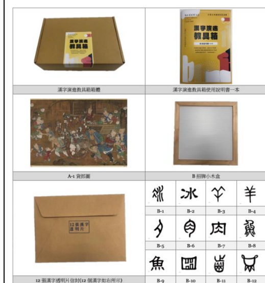
圖 9 漢字演進教具箱教具內容