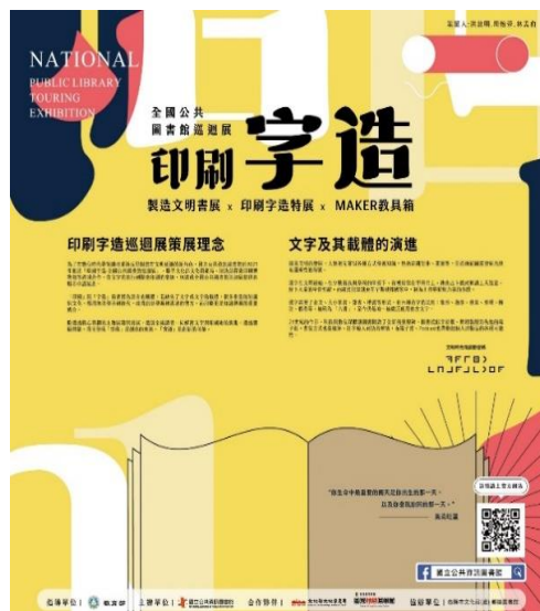
圖 2 文字及其載體的策展理念展架