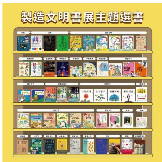
圖 5 製造文明書展兒童青少年選書