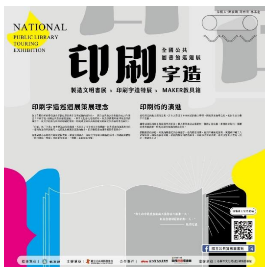
圖 1 印刷術的策展理念展架

伴隨著圖書的誕生，知識的傳遞歷程從手抄逐字謄寫，到印刷術的發明，再到數位科技的崛起，這些變化深刻影響了人們的書寫、設計與閱讀方式。為了讓「印刷字造」巡迴展幫助讀者深入探索知識傳遞的演變（如圖 1、圖 2），在互動中體驗印刷術的歷史與未來。策展從文字的起源切入，以時間軸（如圖 3、圖 4）的方式探討印刷術、字體、文字演化對人類文明的深遠影響，並透過教具箱和桌遊的設計，將這些抽象的歷史轉化為具體的學習素材，讓讀者得以在互動中探索文明的軌跡。