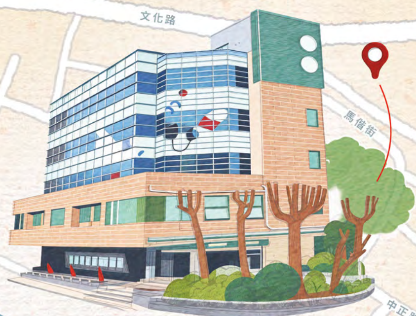
新北市立圖書館 淡水分館