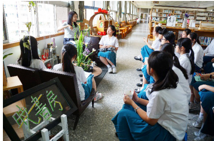
圖6、「曉書房」午茶說書