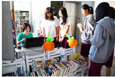
圖2、Stella移動城堡萬聖節借書活動

此外，Stella移動城堡（行動書車）的志工，每日早上先到圖書館為距離圖書館遙遠的高中生準備各類適讀書籍，並帶上學生預借、預約的書籍到高中樓供學生借閱；而本校與臺灣閱讀文化基金會合作成立的「愛的書庫」，服務志工的成員則是本校畢業生的家長，因為認同及喜愛閱讀推動工作繼續留校協助，目前本校「愛的書庫」約有共讀書籍160箱，提供本校師生及全國國中以上學校及閱讀推動團體共讀，服務遍及全國。