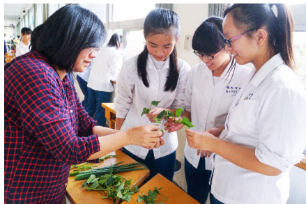
圖10、快樂耕讀-學習扦插

另外，「快樂耕讀實驗計畫」則是曉圖團隊104年開始透過本校自主閱讀課與愛心工作隊幾位志工夥伴嘗試進行的自主學習實驗計畫。起初因為不曉得計畫是否能夠成功，因此名為「實驗計畫」，執行至今頗具成效，目前已是正式計畫。參與計畫的學生，首先須選修自主閱讀課，並提出耕種及閱讀計畫，再由愛心志工家長帶領學生進行耕種指導，從做中學。耕與讀的過程中學生必須透過書本或網路資料研讀栽種作物的相關資料與知識，學習與泥土親近、學習育苗、泥土養護、保水、肥料製作、防蟲等。而志工家長