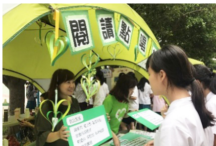
圖4、英文科：閱讀點唱機