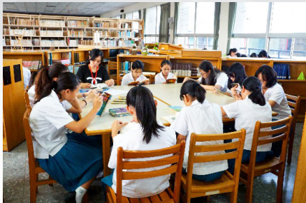
圖9、自主閱讀共讀時間，陪伴孩子閱讀

曉明女中目前尚無閱讀教師，但本校利用暑假開設的圖書館利用教育課程卻早已行之有年。而學期間為國一、二安排的自主閱讀課也進行多年，唯目前配合學校推動一人一藝文的多元選修課程，將其正式納入選修課之一。學生在選擇「自主閱讀課」後還可選擇「耕讀組」或「自主學習閱讀組」。而為了讓學生善用自主閱讀課，我們邀請對帶領閱讀有興趣的志工家長加入引導學生自主學習、自主閱讀的行列。希望除了引導學生快樂且廣泛閱讀外，也能引導學生開始進入主題閱讀，為將來的學習奠基；也透過與他人共讀、共學，達到共好的目標。