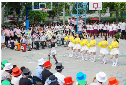
圖3、世界書香日學生與愛媽開幕表演

以2017年「世界書香日－漫轉世界舞閱樂」為例，活動以舞蹈、閱讀、音樂為主軸，每個關卡的活動設計除須忠於主題，還要依分配學科設計該科相關的活動內容；並透過顏色讓六頂思考帽閱讀策略融入，闖關時還須先讓學生通過六感美學考驗。世界書香日活動動用整個曉明女中愛心工作隊成員，其實是愛心工作隊很大的挑戰，因此每屆幹部總兢兢業業的認真投入，帶領隊員用心且認真與圖書館一起規劃。規劃過程除了考驗著工作隊的能力，也挑戰工作隊的溝通、協調及合作性，如過程中有少數隊員為了求表現而無法充分配合，那活動過程就容易產生不快。所幸六年來，