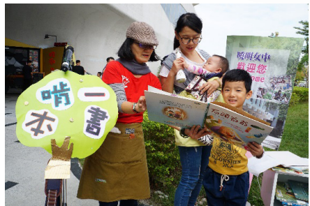
圖7-8、2017臺灣閱讀節：曉明女中攤位（2017）愛心工作隊志工家長不但幫忙學校攤位的閱讀活動，還與學生一起參與舞台展演活動，吸睛的隊伍為活動帶來很多喝采。