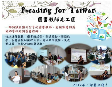
圖1 2017 圖書教師志工團宣傳海報

學知能，師大結合一群熱心的圖書教師、閱讀推手及圖書館主任組成「Reading for Taiwan 圖書教師志工團」，一方面招募對於中小學圖書館閱讀推動具熱誠，且樂於分享的專業師資，另一方面規劃一系列為期二至三天的圖書館經營、閱讀教學及圖書資訊利用課程，讓招募的這些熱血老師可以利用寒暑假期間至偏鄉學校進行圖書教師的培訓。