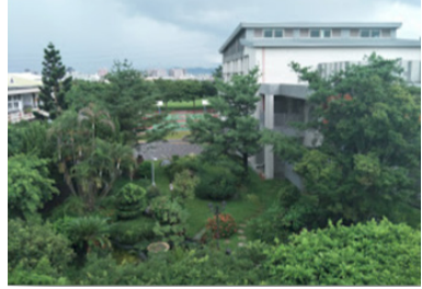
雖然參與研習的老師不少，但是 圖6 服務的學校二校景

跟期程，沒想到因為八月的人事異動，原本聯繫的老師調至別組，因此到八月時聯繫上有些狀況，但是礙於期程已定，所以志工團還是依約到校服務分享。