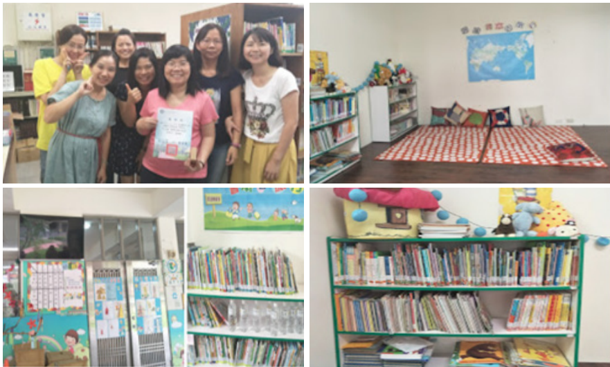
圖5 頒發感謝狀合影留念

志工團服務的第二所學校是位於郊區的一所12班的小型學校，在六月初學校端申請的時候是一位男性設備組長，其圖書教師是位代課老師，很有熱忱想要在學校推動閱讀，在六月底已經敲定服務的時間