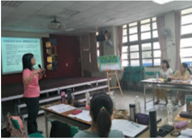
圖3 RFT出團服務分享現場

無私的圖書教師志工夥伴們，沒有任何酬勞補助，但她們願意犧牲假期，一起做志工服務，散播閱讀推動的種子！