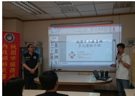
圖8 106年5月18日新住民家庭日圖書館和內政部移民署合作，向新住民介紹多元讀物，並現場至圖書館借書