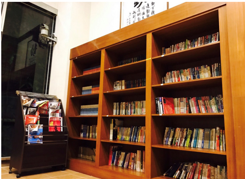
圖2 社區透過補助款申請購置圖書，建置社區閱讀空間

同時，為能與社區建立良好互動關係，及追蹤社區閱讀空間成果，本館特成立社區補助案考核小組，所有館員親自前往每個申請社區，並與管理員或相關人士討論，了解現況，並知悉是否有圖書館可改進之處，透過本補助案及館內的任務型組織，為圖書館和社區搭建了橋梁，這些在在顯示圖書館為加強與社區合作，運用社區資源，因而改變內部環境及管理模式。