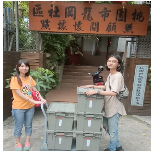
圖5-6 於桃園區龍岡社區發展協會設置書籍