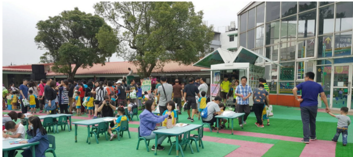
圖4 行動書車服務，為桃園帶來更多閱讀能量