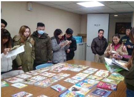
圖7 106年3月9日桃市圖至移民署新住民家庭日推廣閱讀