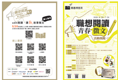
圖8 職想閱讀徵文活動海報

國立公共資訊圖書館配合職人閱讀接力活動，和udn聯合新聞網閱讀頻道與青春博客來合作，分別推出「職人時代」與「職想閱讀」徵文活動，邀請民衆用文字書寫自己的職人體驗，期望透過寫作與創作激發民衆主動閱讀。