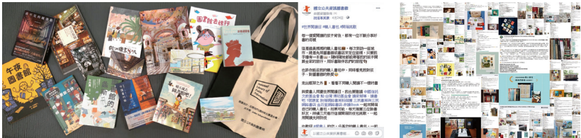
圖6 臉書活動#世界閱讀日#職人書包#開箱挑戰

由國資圖臉書發起Hashtag #世界閱讀日#職人書包#開箱挑戰的活動，邀請各行各業透過照片與書單開箱自己的職人書包，首波Tag邀請受疫情較大的行業官方臉書：網路書店、出版社、作家、非營利組織、劇團、表演藝術，活動期間收到189個官方臉書響應，每個官方粉絲平均粉絲數約10,000人。