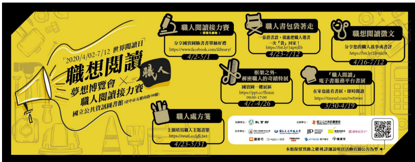
圖1 世界閱讀日-夢想博覽會×職人閱讀接力賽 系列活動海報

為了因應防疫，多數活動轉型為線上辦理，如閱讀講座轉型成線上職人大師講座辦理。也有於臉書等社群媒體辦理線上職人閱讀接力賽，號召名人響應推廣職人書單，同時搭配「框架之外-解密職人的奇蹟」職業試探聯合特展串聯進行，讓活動在線上或實體都廣泛觸及各類型的讀者。