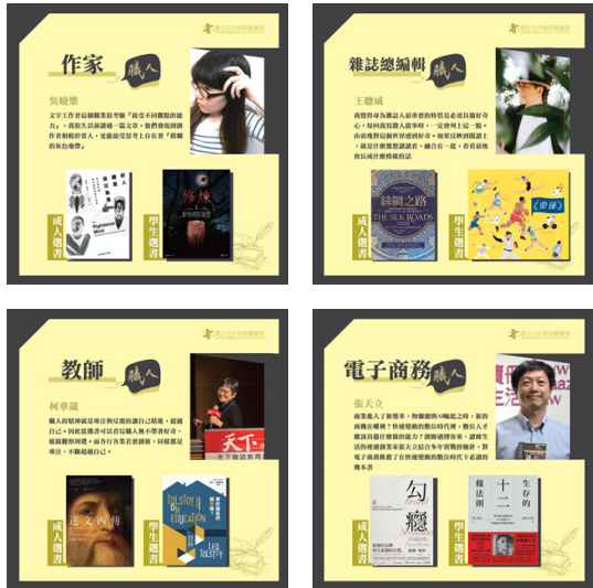
圖3 職人閱讀接力賽臉書貼文圖

2020世界閱讀日國資圖跨域結合閱讀與職涯探索，邀請各行各業頂尖職人推薦好書，在臉書等社群媒體進行職人閱讀接力賽活動。從世界兒童閱讀日(4/2)起至勞動節(5/1)，國資圖官方粉絲專頁上每兩天邀請一位各個領域