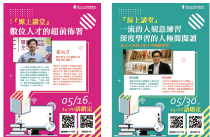
圖7 職人大師線上講座海報

為迎接全球愛書人的節日「2020世界閱讀日」到來，規劃了一系列精彩講座【職人大師講堂】，邀集了各行各業的職人前來分享。因應疫情由於疫情的緣故，將實體講座轉為線上講座，讓全國讀者跨越時空的限制連線收看，詳情請上