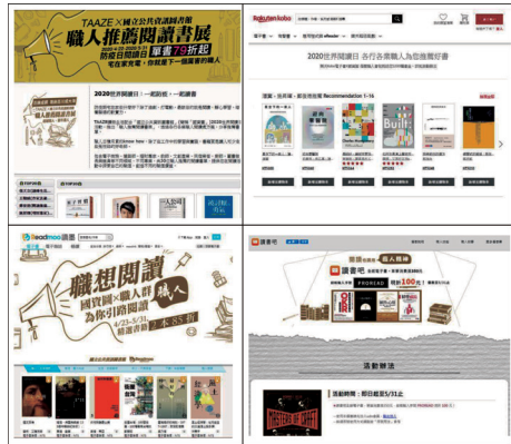
圖5 各家網路書店同步辦理「職想閱讀」線上書展