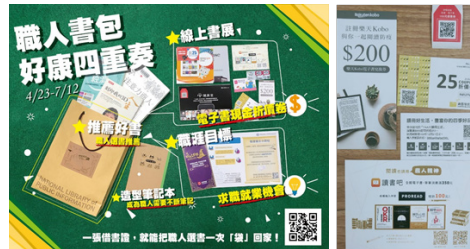
圖4 職人書包袋著走活動海報與防疫知識包酷碰券

考量防疫期間的讀者特性，推出「職人書包袋著走」服務，邀請涵蓋各領域的職人依據專業推薦各類型書單，以主題性的方式將每個職人主題選書，裝入書袋