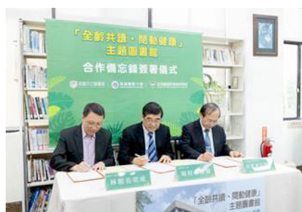
圖6 高雄醫學大學、育英醫護管理專科學校與高市圖於2023年持續擴張合作