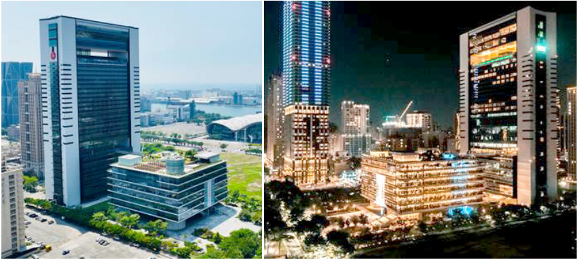
圖9 高雄市立圖書館總館及總館共構會展文創會館