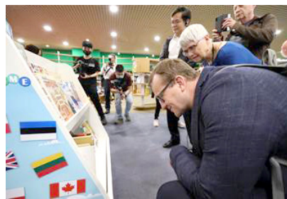
圖15 七國圖書館領導者在擁有43個國家、27種語言，超過16萬本館藏的國際繪本中心尋獲自身國家繪本。