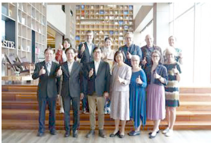
圖14 國家圖書館館長曾淑賢(右4)與七國圖書館領導者到高市圖參訪，高雄市長陳其邁(左3)出席此盛會並交流

高市圖作為圖書館協會聯盟IFLA的會員之一，經由國圖牽線與來自世界各地頂尖的圖書館領導者進行交流，透過實質的交流互動與文化體驗，高市圖總館館舍空間設計以及各種服務，讓外賓驚艷，亦讓國際感受到高市圖為世界可探之公共圖書館。除了交流意義非凡之外，訪團也在高市圖國際繪本中心找到自己國家語言的繪本，使訪團在交流之中增添了幾分趣味。國圖曾淑賢館長曾參與高市圖新總館擘劃，同為新總館建設之引領者，曾館長亦談到高市圖落成開館至今，從當年作為一座具有革命性的新總館，如今(總館二期會館營運)無疑已進入下一個里程碑，當年從沙漠中開出一朵花，如今花朵已成遍地花園，聞見閱讀與文化的芳香。