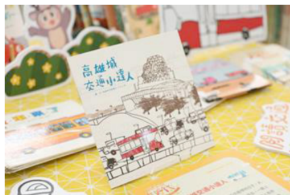
圖8 在地繪本作家帶領高雄市河堤國小學童，一同創作「高雄城交通小達人」繪本