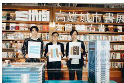
圖10 2022年9月15日高雄城市書展發布會辦於承風書店，高雄市長陳其邁(中)到場宣告全新場域閱讀展開

店聯合舉辦的大型城市活動，限定的港灣書展與草地書市、獨特的文學早餐會、迷人的文學電影院、燒腦的偵探與閱讀論壇作家故事會、驚喜的夢迴圖書館，從白天到黑夜於不同時段、合計百場的閱讀活動，感受群書環抱、不同型態的閱讀體驗。