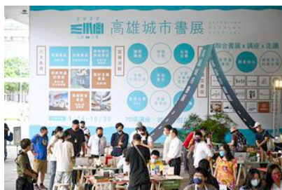
圖11 首屆南部大型戶外書展「港灣書展」，集結超過30家出版社齊聚一堂