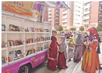
圖4 東南亞行動書車前往社區，紓解移工、新住民思鄉之情