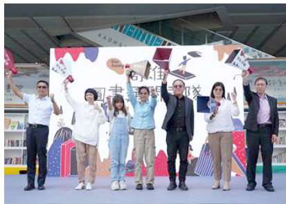
圖3 2022年10月18日「高雄圖書通閱車隊」啟航記者會

(三) 紓解思鄉之情的東南亞書車：針對高雄市約8萬東南亞新住民及移工人口提供東南亞閱讀服務，主動造訪東南亞移民工生活及工作地點，通譯老師隨車服務，讓新住民與移工更加瞭解書車服務，並善用閱讀資源。