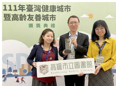
圖5 高市圖摘奪衛福部「共老獎」，為獎項頒發以來第一個獲獎的地方公圖

高雄醫學大學、育英醫護管理專科學校與高市圖持續擴張合作，2023年簽署MOU備忘錄，以三民分館「生活保健」特色館藏，合作建構「全齡共讀、閱動健康」多面向服務，連結到高醫大學及育英醫專教學及醫療資源，與圖書館共同規劃系列課程，滿足各年齡層讀者身心健康保健需求(蘇福男，2023)。