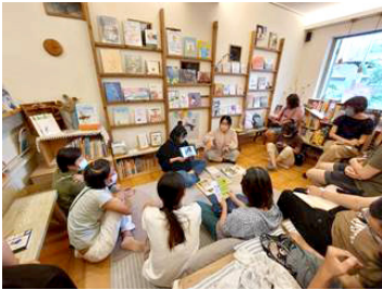
圖 12 「獨立書店系列活動」，讓閱讀的場域延伸並與城市各地的書店交流

疫情打亂了市民生活節奏與阻礙了人際之間的實體交流，高市圖在疫情期間不停歇地透過線上掌握國際圖書事業的發展趨勢與聯繫交流，讓高雄持續接軌國際。在疫情仍嚴峻國境尚未解封高度變動性下，排除萬難、歷經邀約失敗10餘位國際講者，最終力邀日本百萬暢銷小說《在咖啡冷掉之前》作者川口俊和，以及日本電通創意總監暨繪本《麵包國王》作者江口里佳10月來臺，舉辦3場國際講座，近千人參與。在邁入後疫情時代，全世界逐步開放國際交流的同時，在臺灣、在高雄、在高市圖，與市民於秋季寫下溫暖的跨國交流回憶。