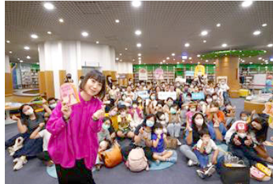
圖 13 排除萬難邀請日本電通創意總監暨繪本《麵包國王》作者江口里佳來臺分享