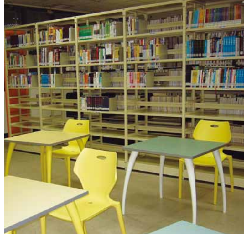
➤ 明亮書庫區，方便學子親近圖書館。

第三步，搬到新館後，藉由每年編列的購書經費，短短2年多的時間，中一中圖書館的藏書迅速增加到3萬多冊，從最新的期刊雜誌、工具書、影片，到師生推薦的專業書籍、各種涵養性