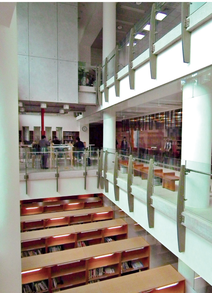
➤ 為了避免館藏潮濕，圖書館人員將藏書集中最室內最明亮的地方。