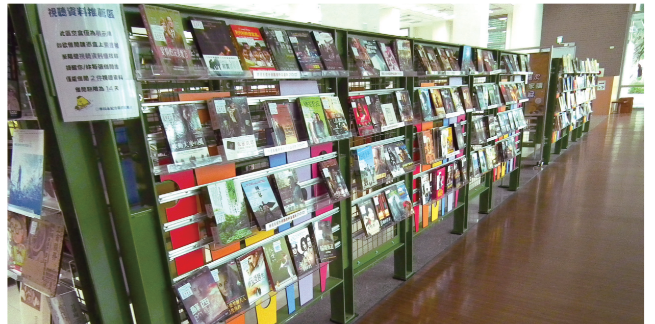
一樓可見視聽資料推薦區，有興趣的民眾再依編號去尋找館藏。

如果士林官邸是位高雅瑰麗的淑女，那麼與其比鄰的李科永紀念圖書館，則宛如滿腹經綸，藏身繁華的謙謙君子。