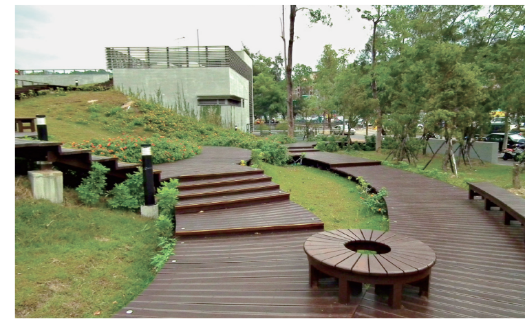
➤ 圖書館特別設計棧道可直接通往頂樓庭園。

此外，每個周末的下午2點，圖書館都會辦理「彩繪週末電影院」活動，播放精采的戲劇影片，讓民眾在這難得的假日裡，一起欣賞影片，從中獲得心靈與思想的啟發。🌀